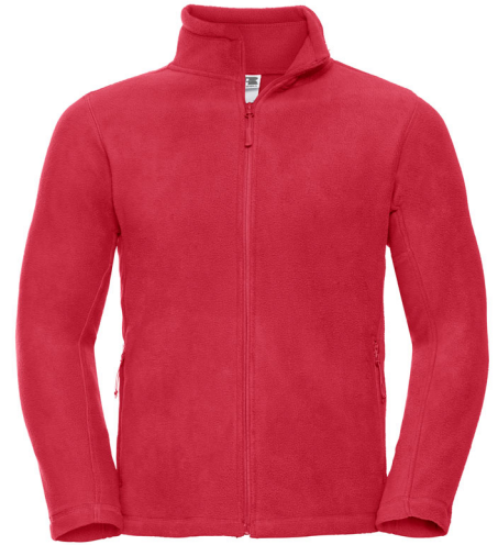
870M Men's Full Zip Outdoor Fleece SIZE XS-4XL