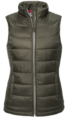
441F Ladies Nano Bodywarmer SIZE XS-3XL